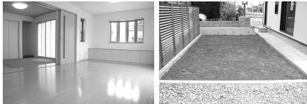
LDKは、明るくて開放的(収納付) 8畳も畳敷きで、カーペットも敷きつめて