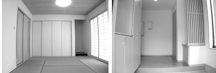
和室で、ゆったりくつろげる。玄関は、おしゃれで大きな収納付